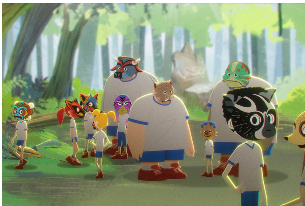
O Bicho Que Eu Tinha Medo